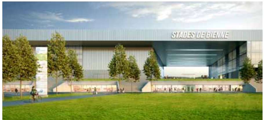
Im Stadionkomplex unter einem Dach: Fussball und Eishockey

In Risch Rotkreuz wurde beim Bahnhof Rotkreuz der Grundstein für die grösste Holzbausiedlung der Zentralschweiz gelegt. Die zweite Etappe des Suurstoffi-Projekts sieht den Bau von neun Wohnhäusern vor. Bauherr Zug Estates investiert dafür rund 100 Millionen CHF. In der ersten Bauetappe entstanden 228 Mietwohnungen und rund 13.000 qm Gewerbefläche. Novartis verlegte seinen CH-Hauptsitz mit 400 Arbeitsplätzen Anfang 2013 in die Suurstoffi; die Swiss International School startete schon im August 2012; im Oktober 2012 eröffnete eine Kindertagesstätte. Die im zweiten Bauabschnitt entstehenden 156 Mietwohnungen (1,5- bis 5,5-Zimmer, alle im mittleren Preissegment) sollen ab 2015 bezugsbereit sein.