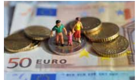
Eurokritiker nehmen die «Fünf-Prozent-Hürde»

>>> CDU/CSU (29%), Bündnis 90/ Die Grünen (14%) und der SPD (9%). Auffallend bei der Befragung ist zudem die Diskrepanz zwischen der gesunkenen Zustimmung zur FDP als Partei und der hohen Zustimmung zu ihren inhaltlichen Positionen. So stimmt mehr als jeder Zweite den aus dem Wahlprogramm der FDP abgeleiteten immobilienwirtschaftlichen Forderungen zu. Sogar unter Grünen-Wählern kann sich fast jeder Zweite mit den Positionen der Liberalen anfreunden. Vor allem die ablehnende Haltung zur Einführung einer «Mietpreisbremse» findet breite Zustimmung (72%). Ausserdem gefällt den Immobilienprofis die gemeinsame Forderung von CDU/CSU und FDP, eine steuerliche Absetzbarkeit von Sanierungsaufwendungen (Sanierungs-AfA) in Höhe von zehn Prozent einzuführen: 71 Prozent kreuzten diesen Vorschlag mit Ja an.