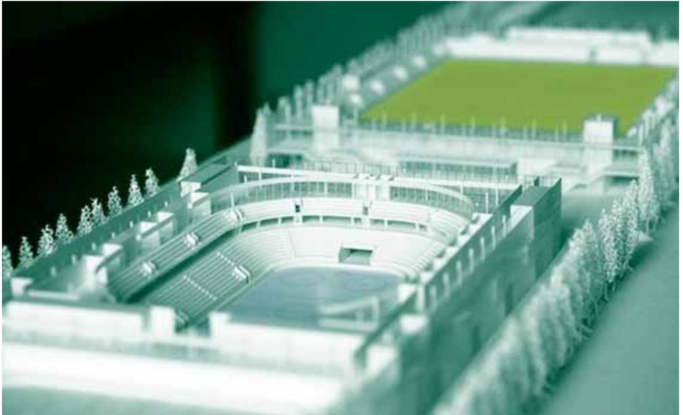
Die Stades de Bienne

ANFANG SEPTEMBER WAR ES SOWEIT: AUF DEM BIELER BÖZINGENFELD LEGTEN DIE BAUHERREN UND VERTRETERER VON BIELER SPORTCLUBS DEN GRUNDSTEIN FÜR DIE STADES DE BIENNE.