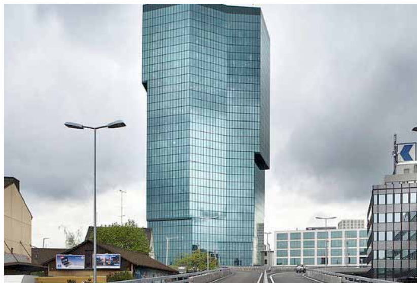
IFRS 13: Renditeliegenschaften sind nach dem «highest and best use» zu bewerten

DZ/AM. Gemäss IFRS 13 ist der Fair Value einer Renditeliegenschaft neu auf Basis der bestmöglichen Nutzung (highest and best use) der Liegen- schaft zu ermitteln. Die bestmögli- che Nutzung basiert auf der Sicht der Marktteilnehmer und kann entspre- chend von der heutigen oder auch der geplanten Nutzung des Eigentümers abweichen. Die Einführung des Kon- zepts der bestmöglichen Nutzung ist der wesentliche Unterschied zu den Bestimmungen unter IAS 40; dieser lies die Bilanzierung der künftigen Potenziale einer Umnutzung explizit nicht zu. Der Standard gibt für die bestmögliche Nutzung drei Kriterien vor: 1.) physisch (technisch) möglich, 2.) rechtlich zulässig und 3.) finanzi- ell machbar.