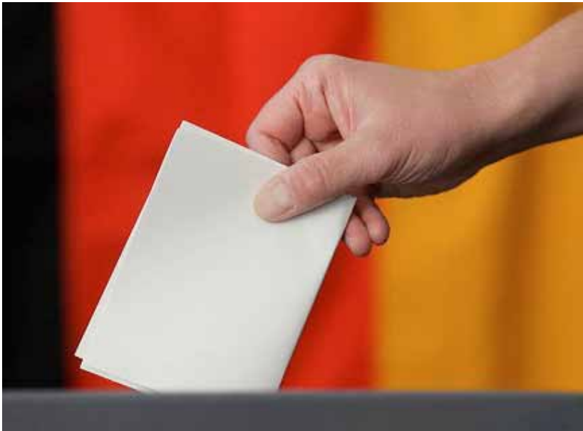
Bundestagswahlen 2013: CDU/CSU liegt bei Immobilienprofis in Führung